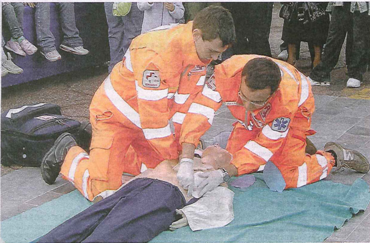
IN AZIONE Oltre al soccorso, in Croce Viola ci sono anche gli anziani che operano nei servizi ausiliari

fattore di coesione sociale e lavoriamo per una cultura che sia motore del cambiamento, strumento di emancipazione delle persone, qualità di vita e benessere sociale, e che crei senso di appartenenza alla propria città». La cultura come bene comune, quindi, anche grazie alla presenza di una struttura come Cascina Grande. Il centro culturale di via Togliatti, con le sue biblioteche adulti e ragazzi, è il fiore all'occhiello dell'offerta culturale rozzanese. «In Cascina